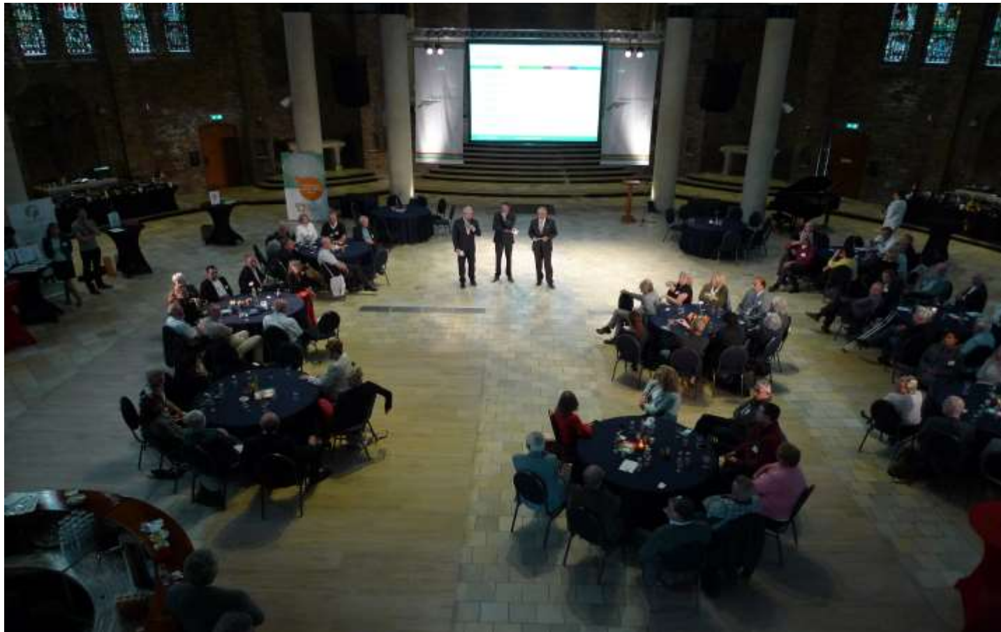
Opening Regiodag 1 oktober 2014 Cultuurkoepel Heiloo