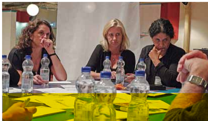
Hoe zetten we onszelf op de kaart in Haarlem, Den Haag en Brussel?